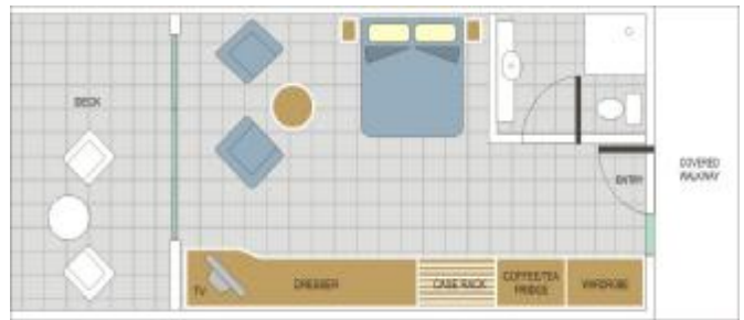
スーベリア・プールビュールーム