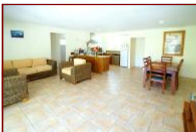
エグゼクティブ・3ベッドルーム・ヴィラ・ユニット